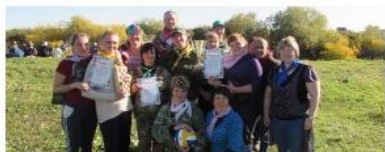
В сентябре месяце 9 педагогов приняли участие областном педагогическом фестивале-конкурсе «Я – ВОСПИТАТЕЛЬ!»